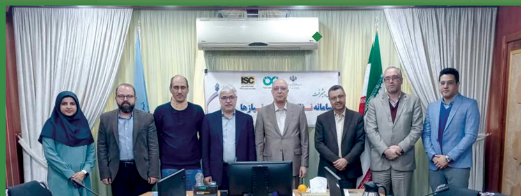
پنجمین جلسه کمیته اجرایی نظام ایده ها و نیازها (نان) برگزار شد.