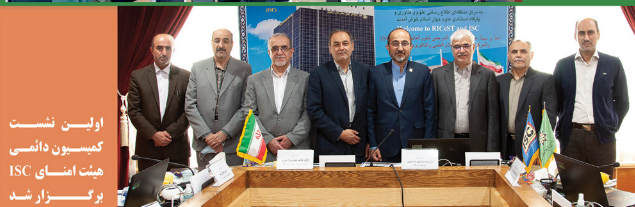
اولین نشست کمیسیون دائمی هیئت امنای ISC برگزار شد