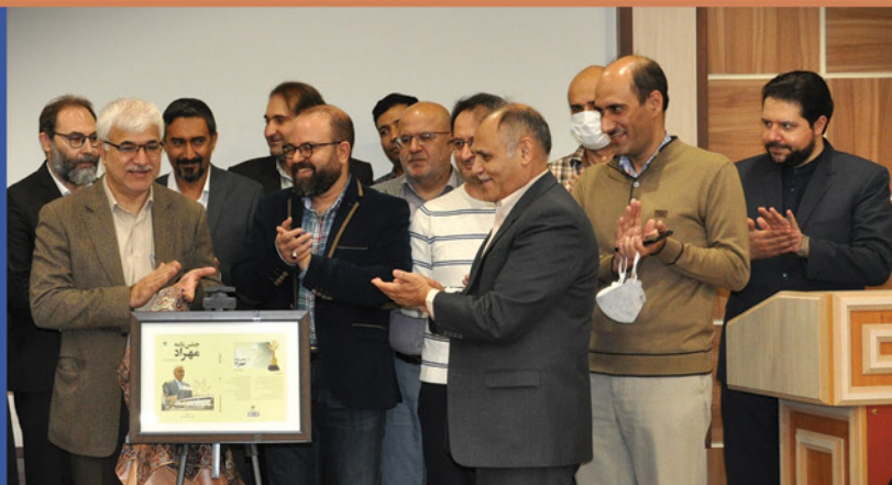
رونمایی از کتاب «جشن نامه مهرداد» در هفته کتاب و کتابخوانی

بازدید رؤسای پردیس های دانشگاه فرهنگیان کشور از ISC